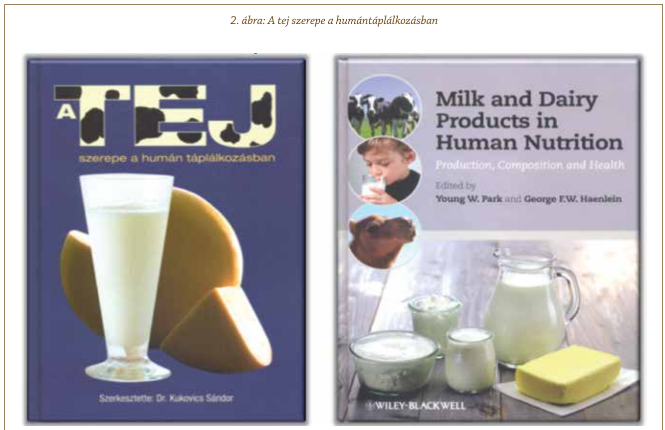
2. ábra: A tej szerepe a humántáplálkozásban

A 2014-ben rendezett konferencia programja keretében került sor a IV. Magyarországi Kecske- és Juhtejtermék-verseny megrendezésére (2014. április 8.), amelyen a hazai szakemberek mellett spanyol, olasz, dél-afrikai és lengyel szakér-