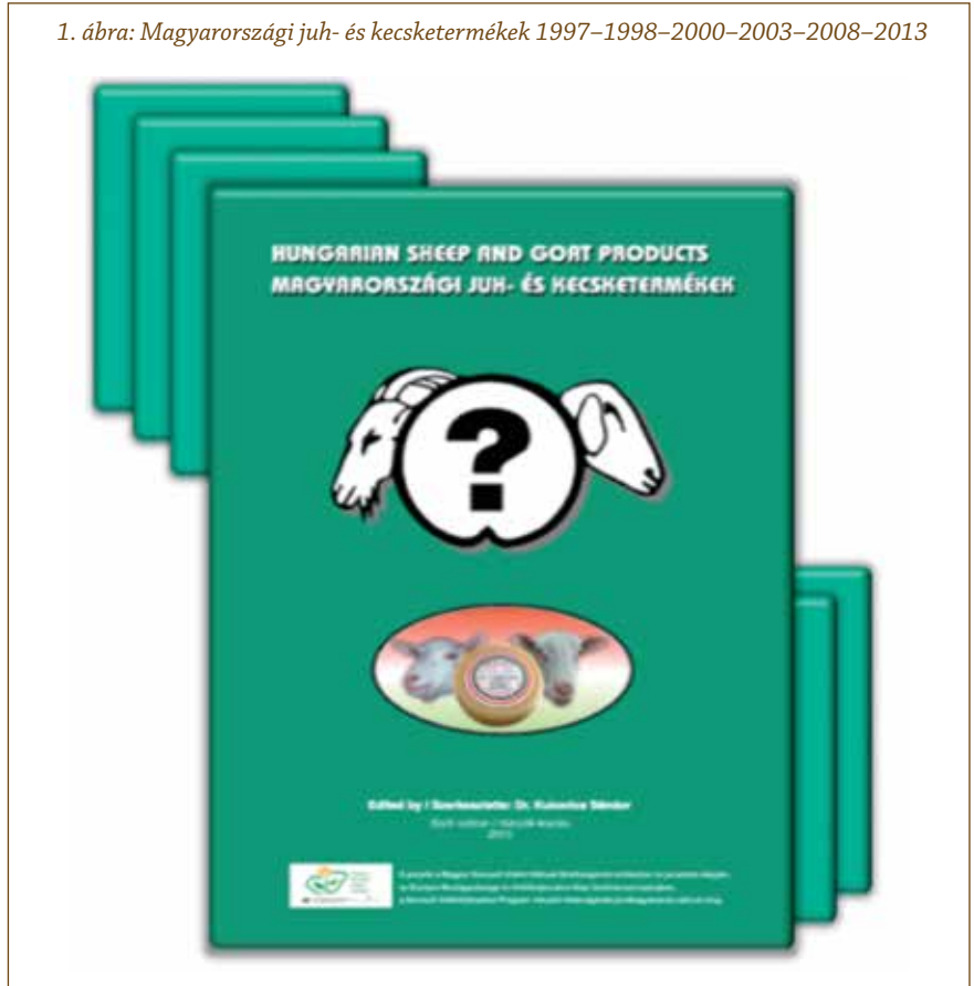
1. ábra: Magyarországi juh- és kecsketermékek 1997–1998–2000–2003–2008–2013

vizsgálat eredményeként 2015. október 28-ával megerősítette az Egyesület közhasznú minősítését.